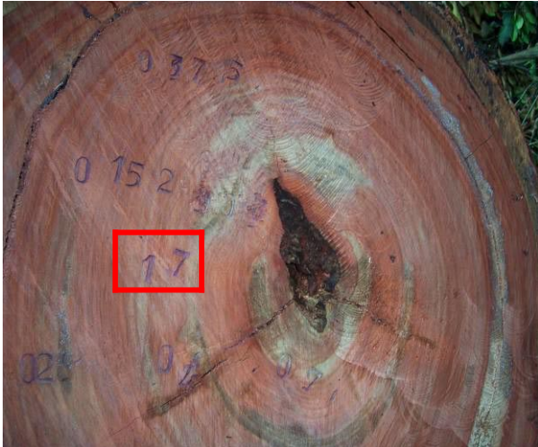
Figure 1 Grume de padouk abandonnée