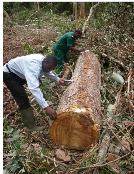
Figure 3 Bille d'iroko abandonnée

La mission a observé que la société SFW abandonne en forêt des bois non enregistrés dans les carnets de chantier (DF10). Ceci revient à dire que cette société n'enregistre dans ses carnets de chantier que les longueurs qui lui sont utiles, soit les grumes qu'elle est en mesure de commercialiser, en lieu et place des longueurs réelles des grumes. A l'issue d'un tour sur quelques pistes de débardage, la mission a répertorié une bille d'iroko de 5,50m de long (voir figure 3) et deux grumes entières (iroko et padouk) respectivement de 15 et 20m de longueur, ne figurant pas dans le carnet de chantier.